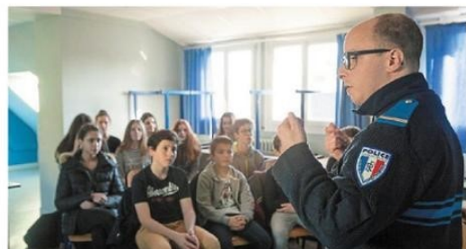
Jeudi, la police municipale de Pornichet et la police nationale ont sensibilisé les élèves du Sacré-Cœur au harcèlement. L'omniprésence des réseaux sociaux fait entrer le harcèlement à la maison, dans l'intimité des jeunes. On comprend alors tout l'enjeu de l'information sur ce phénomène et les ravages qu'il occasionne.