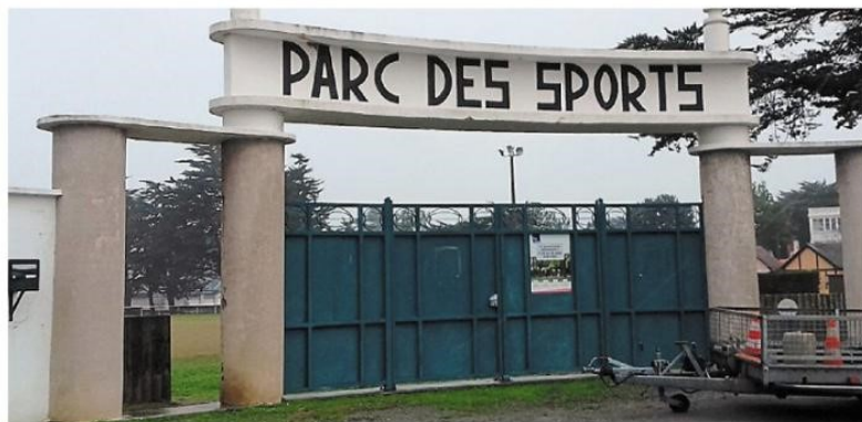
Après 80 ans de bons et loyaux services, le Parc des sports a tiré sa révérence au monde sportif.

Au départ, le terrain était entouré par des ganivelles. Après la guerre, on les a remplacées par des poteaux en ciment, récupérés sur la plage. C'est aussi à cette période que le stade a été baptisé du nom de Louis Mahé, lorsque celui-ci est décédé