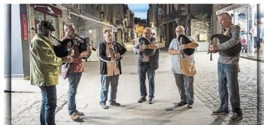
Les Veuzous de la Presqu'île partageront leur vaste répertoire avec le public le samedi 24 février, à 20 h 30.

Les responsables du musée des marais salants propose régulièrement des animations, en particulier lors des vacances scolaires. Du 10 février au 11 mars, de nombreux temps forts seront au rendez-vous.