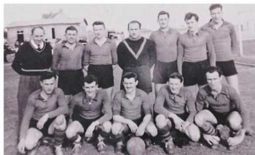
En 1950, le Parc des Sports était seulement doté d'une baraque qui servait de vestiaire pour les joueurs.

Je n'ai jamais quitté l'ESP depuis 1952. Je suis passé de joueur à dirigeant et j'ai fréquenté le stade Mahé jusqu'à sa fermeture, en parallèle du stade Prieux bien sûr. Je comprends les logements qui vont s'y faire, même si j'aurais aimé le garder, comme beaucoup. J'ai de la nostalgie, mais il faut vivre avec son temps ! >>>